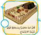
كان الله حاضرًا بسخانة فوق خيمة الاجتماع.